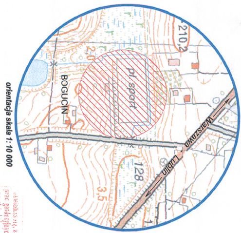
orientacja skala 1 : 10 000

Uwaga: Przedmiotowa działka nie posiada jednoznacznie określone współrzędnych granic.